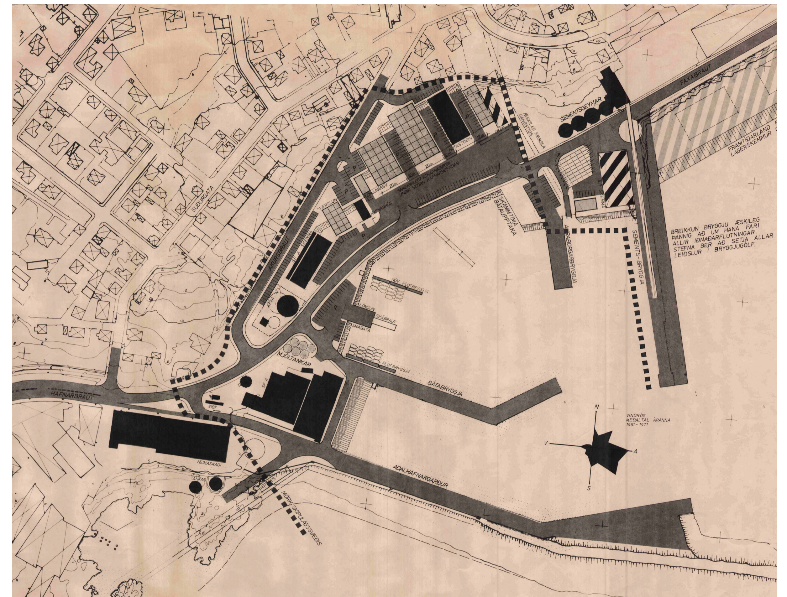
Akraneshöfn. Tillaga að breyttu deiliskipulagi.

Í tengslum við vinnu að nýju deiliskipulagi Sementsreits var ákveðið að breyta skipulagsmörkum deiliskipulags Akraneshafna. Sementsbrýggja og athafnasvæði á lóðinni Faxabraut 10 voru tekin sem hluti Sementsreits.